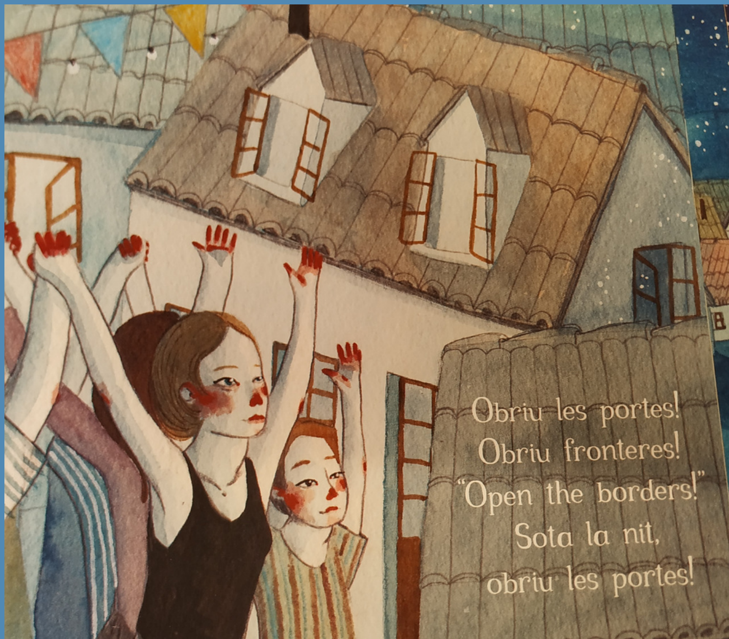
Il·lustració de Gemma Capdevila per al conte Obriu les portes de Txarango.