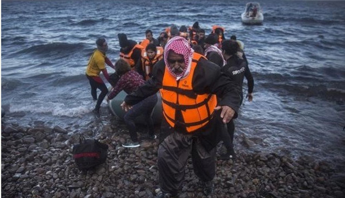
Refugiats arribant a Europa.

Amb motiu d'aquesta commemoració hem elaborat una guia bibliogràfica i de recursos en línia a la Biblioteca Josep M. Llompart sobre el tema.