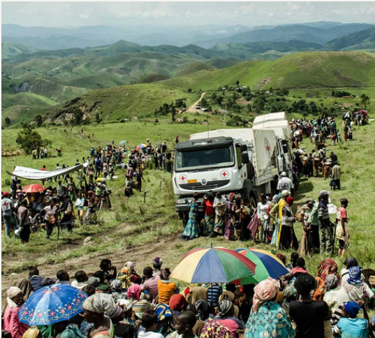
En 2016, el Comité Internacional de la Creu Roja (CICR) va repartir aliments entre 1.750 desplaçats i famílies de residents en Mushangi (RDC).

Per la seva banda, els països menys desenvolupats proporcionen asil al 27% del total. A més, la major part de les peticions d'asil es varen registrar als Estats Units, Alemanya i Espanya. Al nostre país, concretament, la major part procedien de veneçolans i colombians.