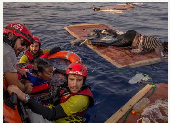
Rescat de l'Open Arms.